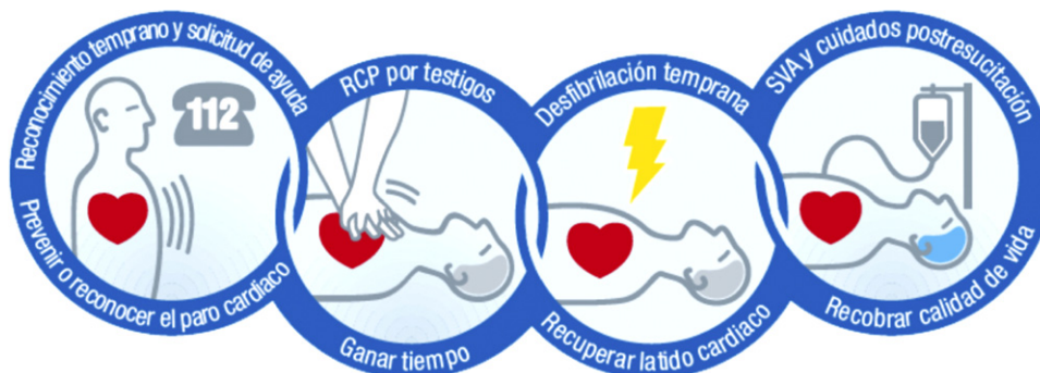
Figura 1 Cadena de supervivencia.